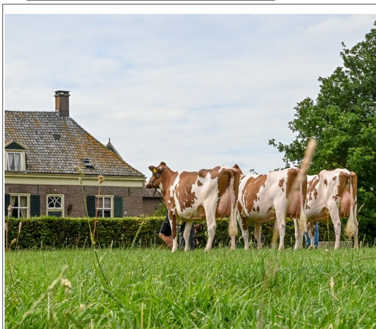
Dochters van Crown Red